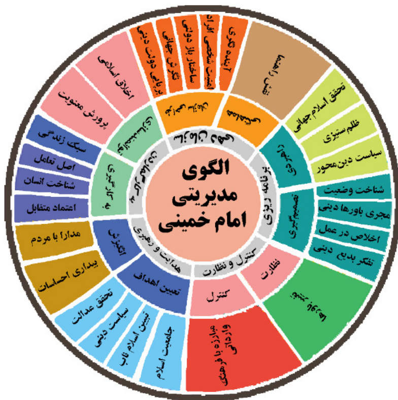
نمودار ۲. مدل تحلیلی تحقیق