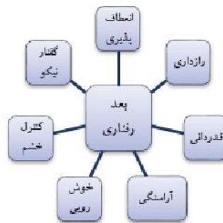
شکل ۱. مدل پیشنهادی اولیه جهت تعیین برازش بعد رفتاری

در بررسی برازش مدل بعد رابطه رفتاری برخی گویه‌ها به علت بار عاملی اندک (کمتر از ۰/۳) و غیرمعنادار حذف شدند. همچنین، از شاخص‌های اصلاح برازش برای اصلاح مدل استفاده شد. با استفاده از این شاخص‌ها، کوواریانس میان خطاهای اندازه‌گیری و واریانس متغیرهای مشاهده‌شده از حالت ثابت به آزاد تبدیل شده و به کاهش کای اسکور و ارتقای شاخص‌های برازش مدل کمک کرد. جهت اختصار شاخص‌های کلی برازش مدل اصلاح‌شده رابطه رفتاری زوجین در جدول ۲ آورده شده است.